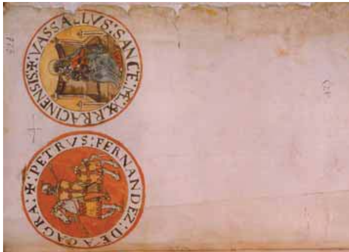
Figura 5. Sello de Pedro Fernández de Azagra, vasallo de Santa María de Albarracín y sello de Álvaro Pérez de Azagra.