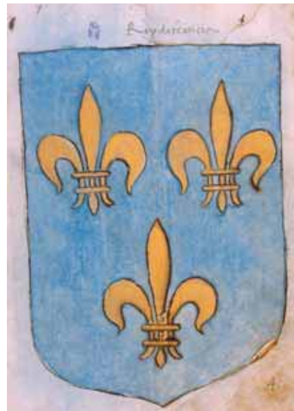
Figura 6. Escudo de la Iglesia, escudo del Imperio, escudo del Rey de Francia.