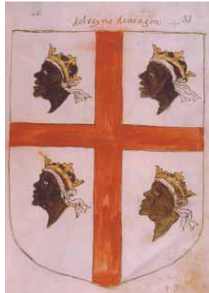
Figura 7. Escudo del Rey de Aragón (barras), escudo del Rey de Sobrarbe, escudo del Reino de Aragón (cruz de Íñigo Arista), escudo del Reino de Aragón (cabezas de moros).