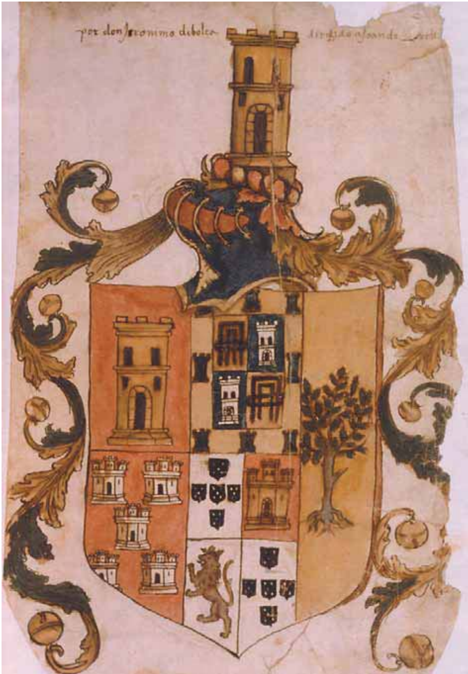
Figura 1. Escudo «grande» de Bolea.