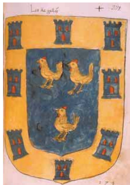
Figura 8. Escudo del linaje Deza de Portugal, escudo del linaje de Bolea y escudo del linaje de Galloz.