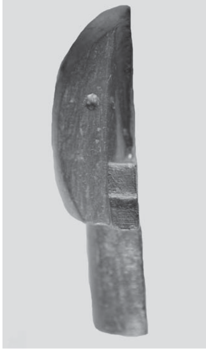
Figs. 11 y 12: CP-15.