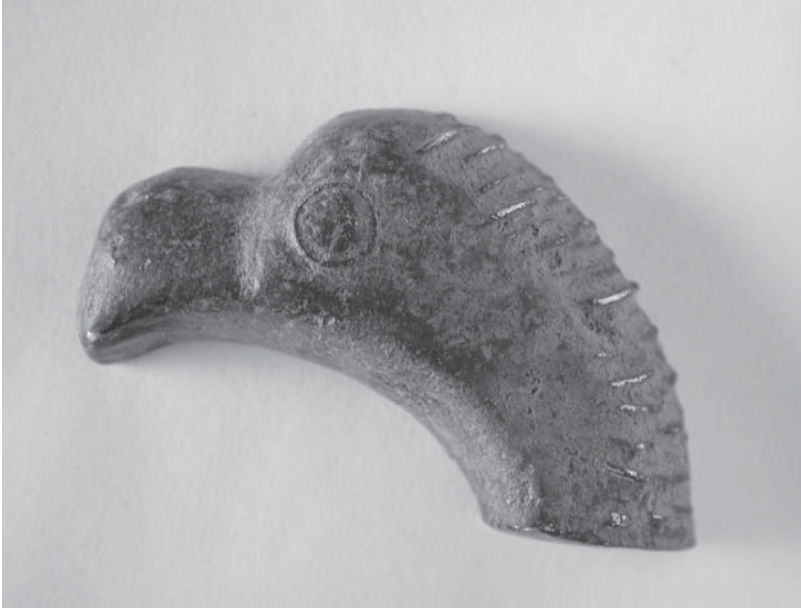
Figs. 16-17: CP-6.