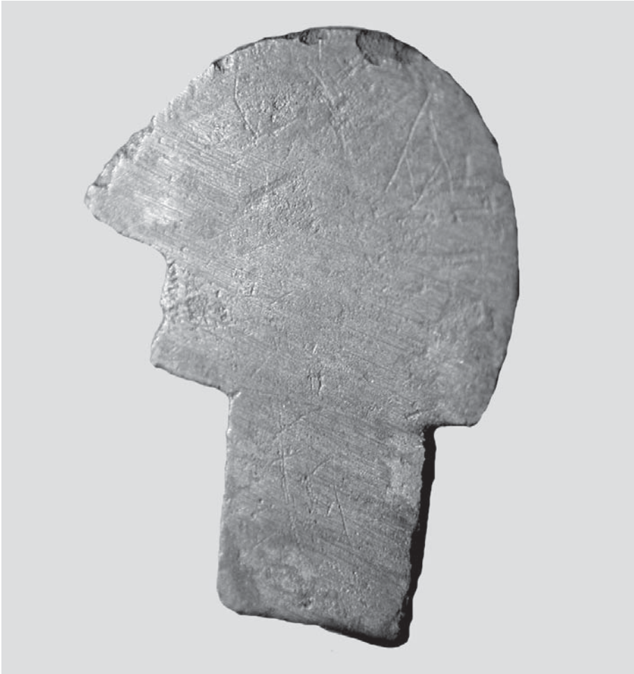
Fig. 13: CP-15.