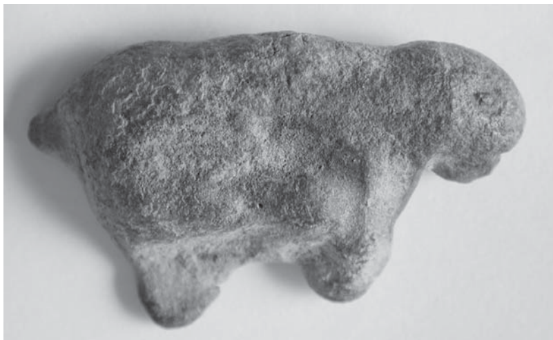
Figs. 7 y 8: CT-18.