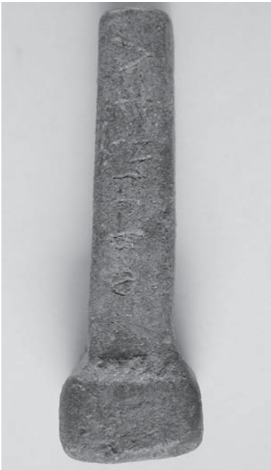
Fig. 1: CT-13.

Marín Almagro-Gorbea Universidad Complutense de Madrid e-mail: anticuario@rah.es