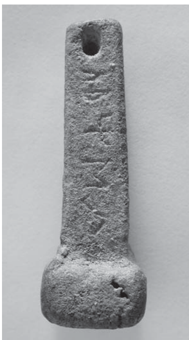
Figs. 3 y 4: CP-13.