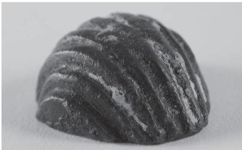
Figs. 18 y 19: CP-10.