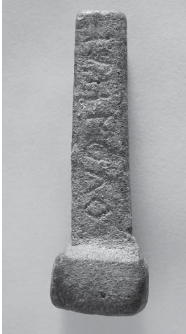
Figs. 4 y 5: CT-13.