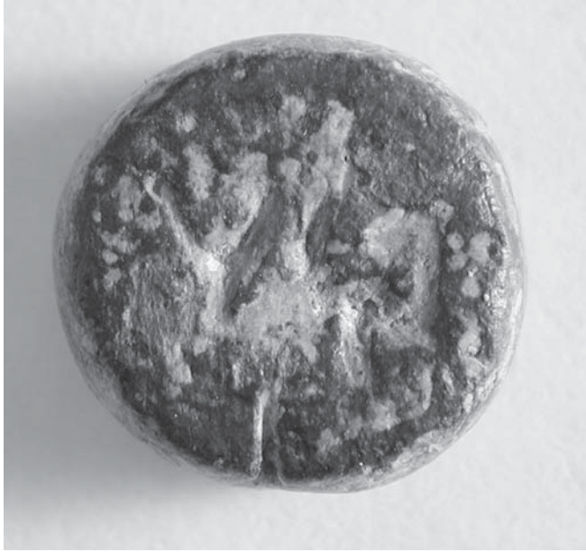
Figs. 9-10: CT19.