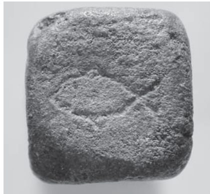
Fig. 2: CT-13.