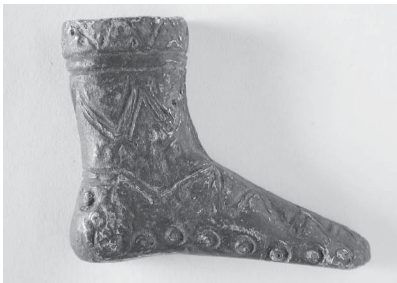
Figs. 14 y 15: CP-12.