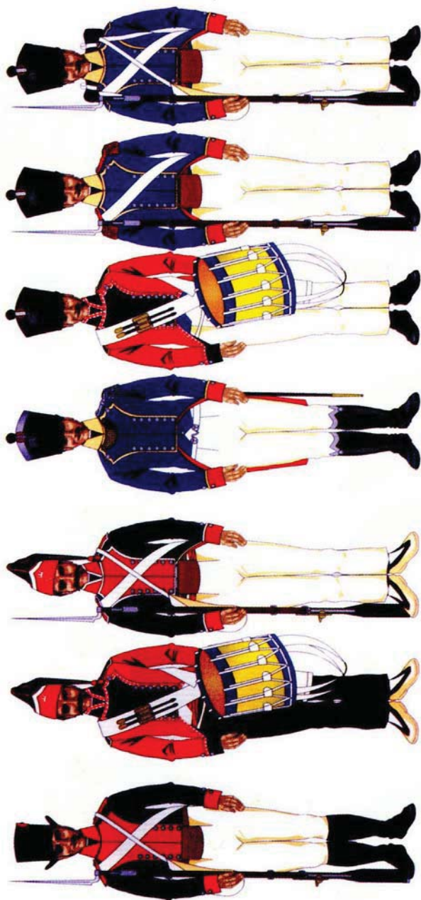
Figura 6. Uniformes del Batallón (1809-1815). De izda. a dcha.: Fusilero 1809, Tambor 1811, Fusilero 1811, Alférez 1813, Tambor 1813, Sargento y Fusilero 1813.