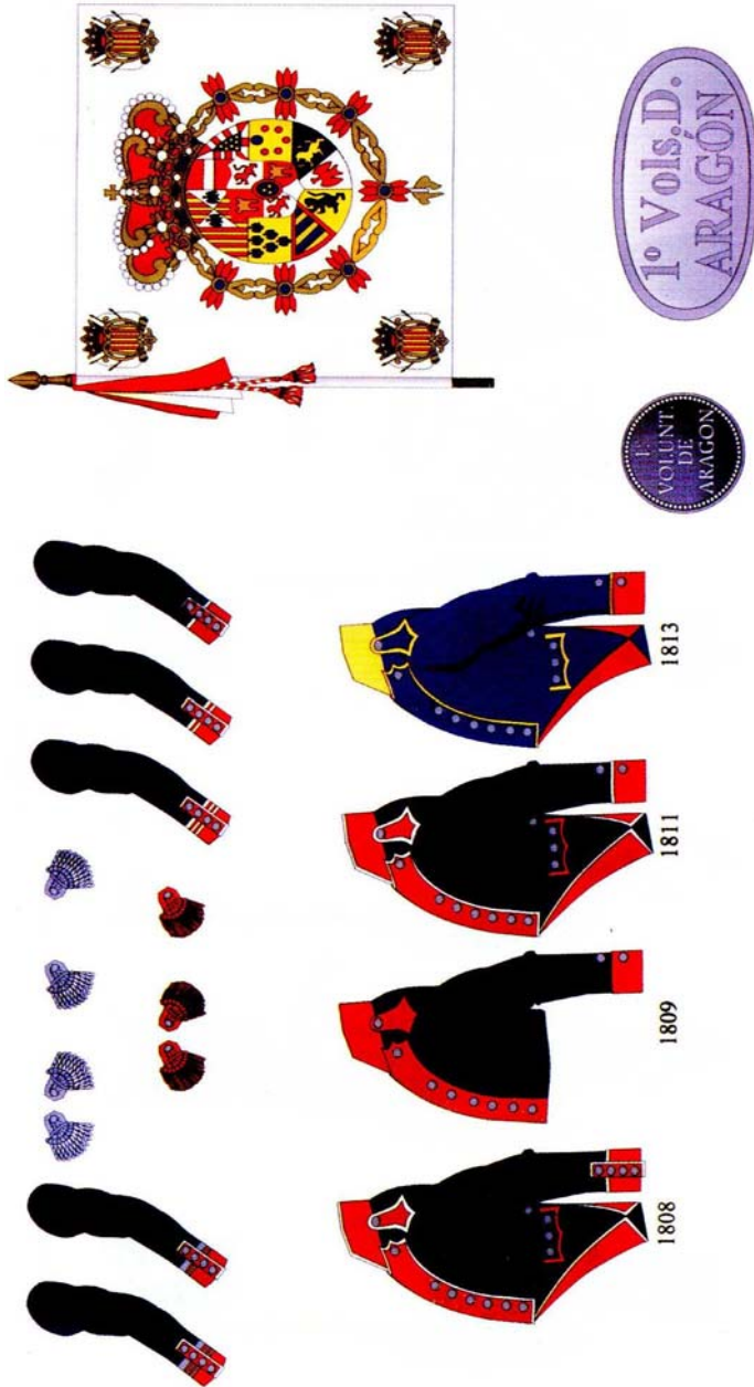
Figura 7. Divisas de mando, izda a dcha: Teniente Coronel, Sargento Mayor, Capitán, Teniente, Alférez, Sargento 1.º, Sargento 2.º, Cabo 1.º, Cabo 2.º, Fusilero. Casacas de tropa 1808, 1809, 1811 y 1813. Bandera Coronela 1808, botón 1808 y placa de morrión 1813.