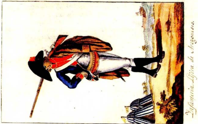
Figura 1. Estado Militar de 1805.