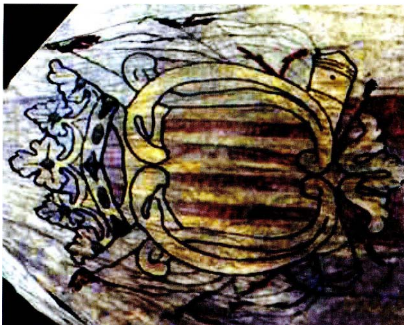
Figura 4. Detalle del escudo regimental en su bandera de 1762, idéntico al usado en 1808 (Templo del Pilar, Zaragoza).