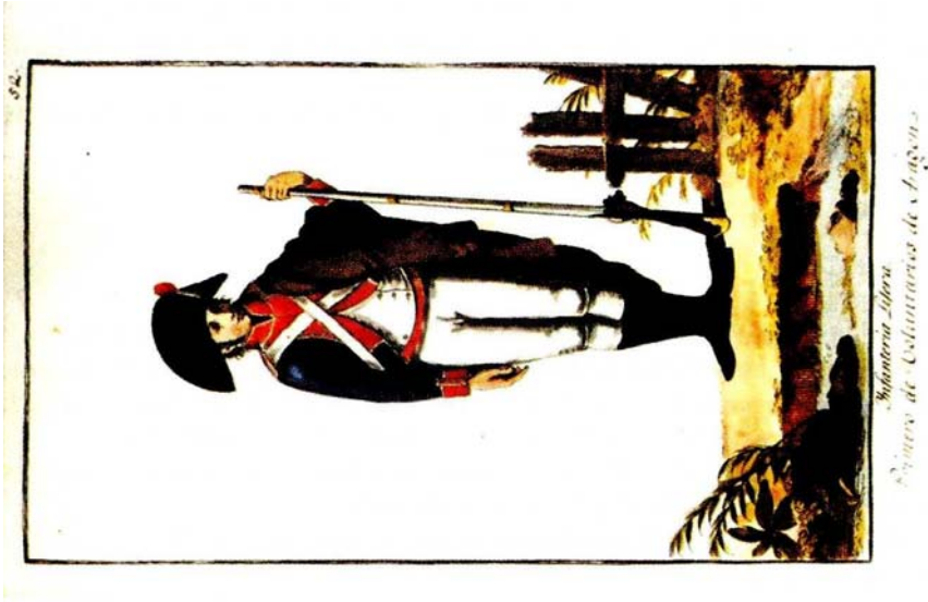
Figura 2. Estado Militar de 1806.