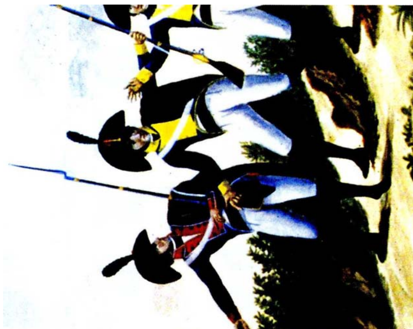
Figura 3. Manuscrito de Ordoivás (1807).