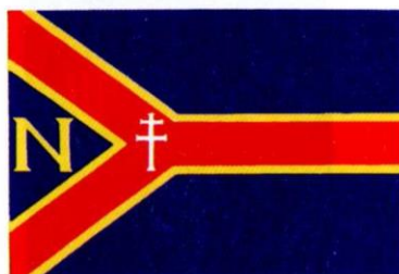
NOMBREVILLA. Decreto 78/1999, de 8 de junio, del Gobierno de Aragón. Boletín Oficial de Aragón , número 77, 21 de junio de 1999.