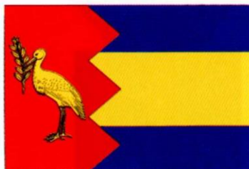
FRÉSCANO. Decreto de 17 de noviembre de 1999, del Gobierno de Aragón.