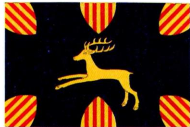
CERVERUELA. Decreto 70/1999, de 8 de junio, del Gobierno de Aragón. Boletín Oficial de Aragón , número 77, 21 de junio de 1999.