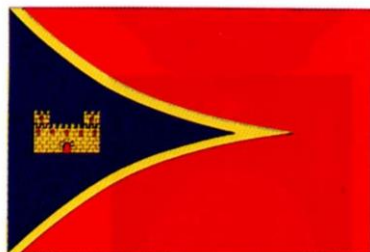
NOVALLAS. Decreto 76/1999, de 8 de junio, del Gobierno de Aragón. Boletín Oficial de Aragón , número 77, 21 de junio de 1999.