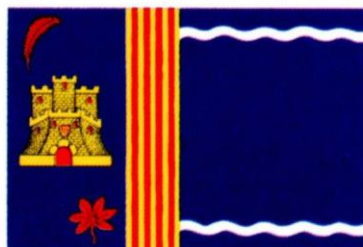
LA ALMOLDA. Decreto de 17 de noviembre de 1999, del Gobierno de Aragón.