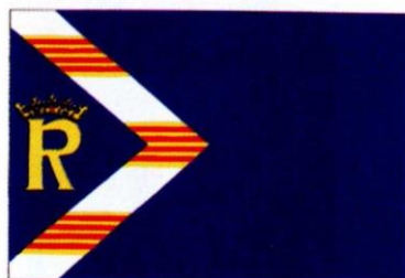
RETASCÓN. Decreto 77/1999, de 8 de junio, del Gobierno de Aragón. Boletín Oficial de Aragón , número 77, 21 de junio de 1999.