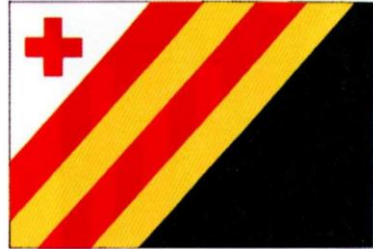
TIERZ. Decreto 69/1999, de 8 de junio, del Gobierno de Aragón. Boletín Oficial de Aragón , número 77, 21 de junio de 1999.