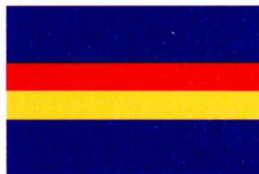
BOTORRITA. Decreto 74/1999, de 8 de junio, del Gobierno de Aragón. Boletín Oficial de Aragón , número 77, 21 de junio de 1999.