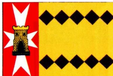
FUENDEJALÓN. Decreto 73/1999, de 8 de junio, del Gobierno de Aragón. Boletín Oficial de Aragón , número 77, 21 de junio de 1999.