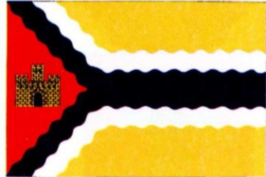
CASTILISCAR. Decreto 71/1999, de 8 de junio, del Gobierno de Aragón. Boletín Oficial de Aragón , número 77, 21 de junio de 1999.