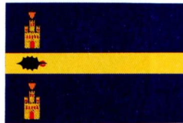
TRAMACASTILLA DE TENA. Decreto 72/1999, de 8 de junio, del Gobierno de Aragón. Boletín Oficial de Aragón , número 77, 21 de junio de 1999.