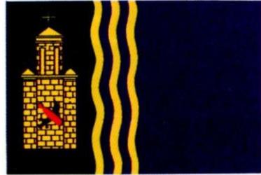
VIERLAS. Decreto de 17 de noviembre de 1999, del Gobierno de Aragón.