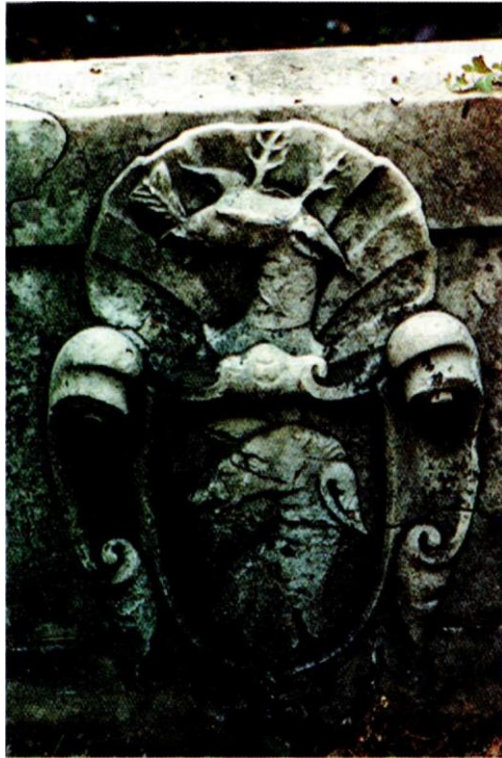
Figura 7b. Esempio di cimiero.

Dunque ci troviamo in presenza di una committenza molto consapevole, pienamente conscia della propria identità in quanto comunità omogenea in territorio straniero e molto attenta alle proprie origini ed alla loro riaffermazione anche tramite l'uso del linguaggio araldico. Una committenza che porta in Italia, oltre ai propri usi ed alle proprie attività professionali, anche le proprie specifiche consuetudini blasoniche, dimostrando così come l'araldica stessa in questo periodo sia sentita ancora come un elemento vivo e denso di significati personali e sociali, rappresentando con il suo insieme di figure, colori e pezze , l'immagine visiva di antiche ed originali storie familiari.