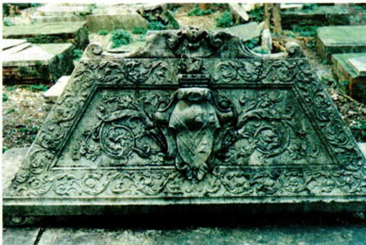
Figura 6a. Esempio di decorazione tombale con scudo completo di open coronet .