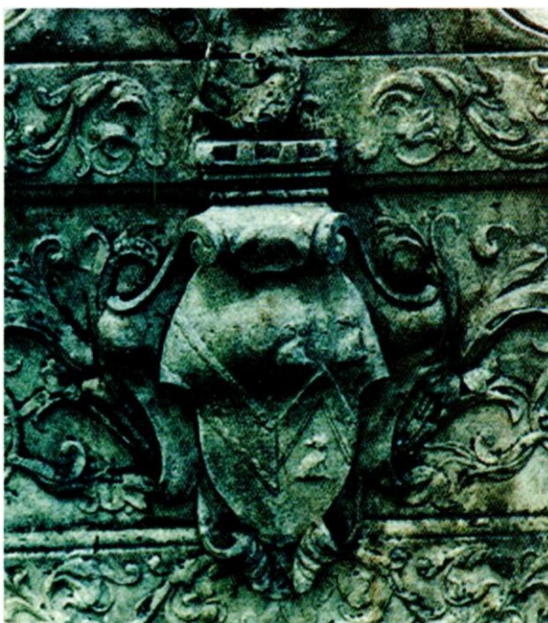
Figura 6b. Esempio di open coronet : particolare.