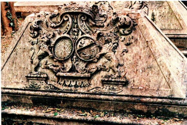
Figura 9. Arma Langlois.