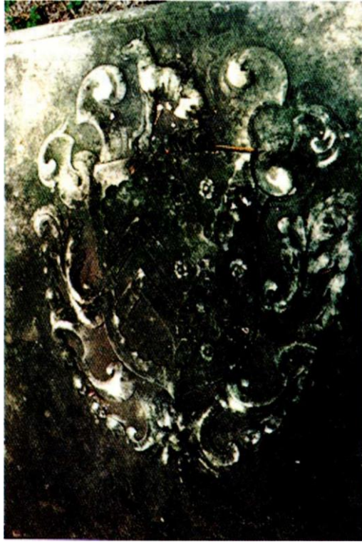
Figura 3. Esempio di crocette ricrocettate, spillatura, cercine con cimiero.