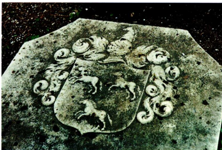
Figura 7a. Esempio di cimiero.

cimiero una figura araldica presente nello scudo, alcune volte mantenendola pressoché identica, altre volte trasformandola in maniera però da conservare ben riconoscibili le proprie fattezze: è il caso di una testa caprina, la quale, replicata nel cimiero con l'apposizione di corna, viene a tal punto modificata da divenire araldicamente una testa di cervo. 12 (Figure 7a-7b)