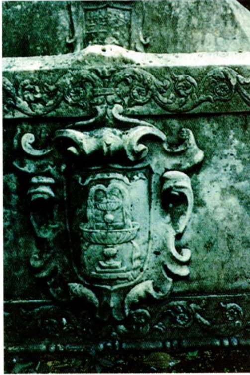
Figura 8. Arma Lafonte.