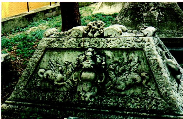
Figura 1. Esempio di decorazione tombale.

E' da notare come la presenza di stemmi, scolpiti o incisi sui marmi, sia piuttosto estesa. Anche se non tutti i monumenti funebri sono accompagnati da un'insegna gentilizia, in alcuni casi questo elemento assume un carattere decorativo preponderante, tanto da riempire, a volte interamente, un lato del sepolcro con le elaborate forme dello scudo e con il dispiegarsi delle proprie ornamentazioni esteriori sia di carattere araldico (elmo, cimiero, svolazzi, figure reggiscudo), che di natura non strettamente araldica (nastri, racemi, festoni di fiori e frutta che si dipartono e si legano allo scudo). (Figura 1).