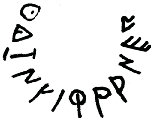
Figura 1.- Grafito sobre fusayola troncocónica de barro.