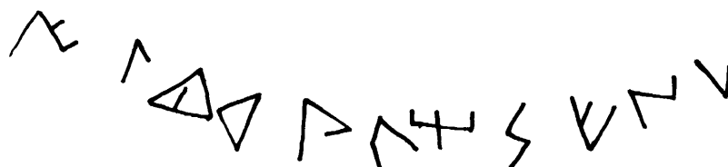
Figura 4.- Grafito sobre ánfora.