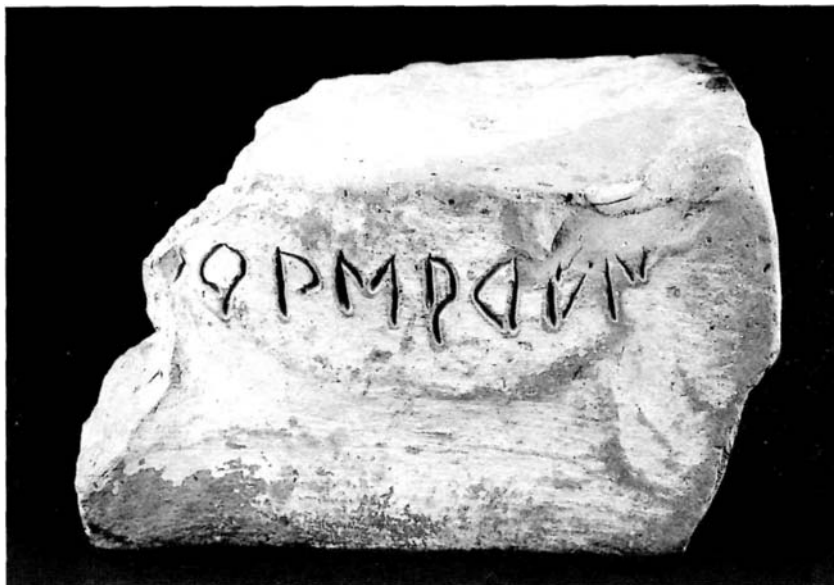
Figura 3.- Grafito sobre pondus.