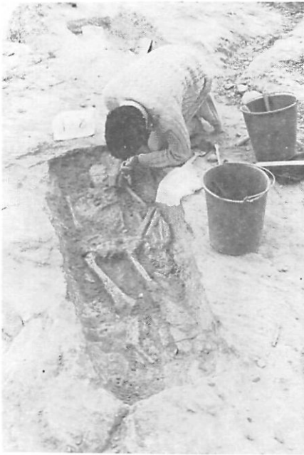
Fot. 8. Excavación de una de las tumbas de la necrópolis medieval del Tossal de les Forques (La Sentiu de Sió) (año 1985).