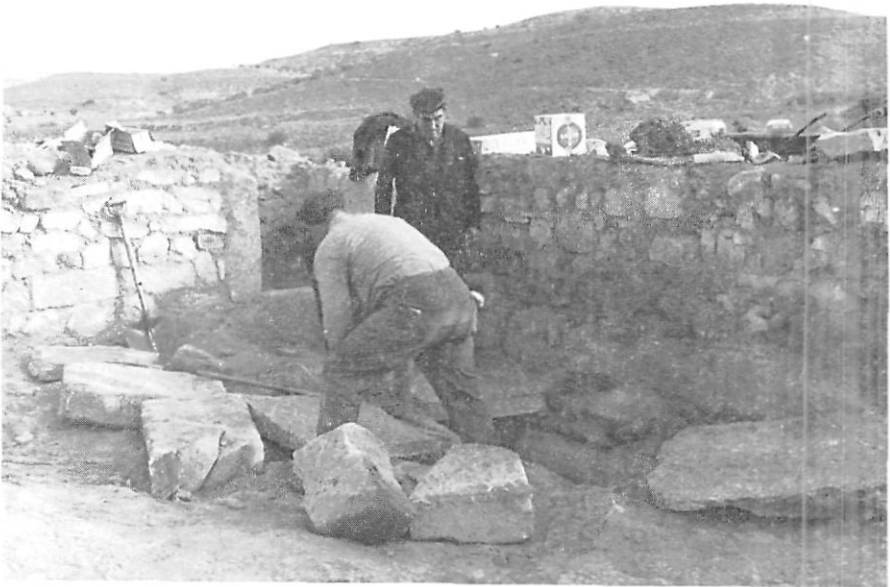
Fot. 4. La Brigadilla de especialización Monumental y Arqueológica durante los trabajos de excavación en Bobalá (Serós) (año 1969).