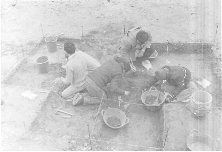
Fot. 7. Inicio de la excavación del fondo de cabaña de Tapió (Gimenells, Alpicat). (Años 1984).