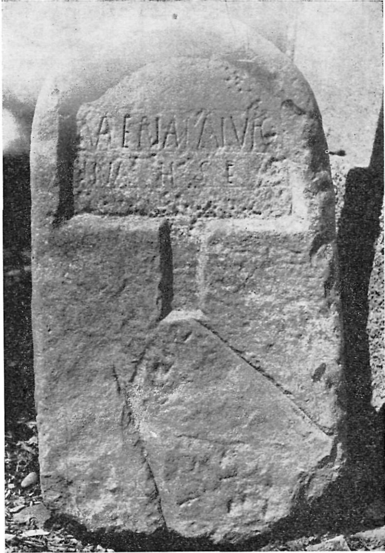
FIG. 1. Estela romana de Luna (Zaragoza).