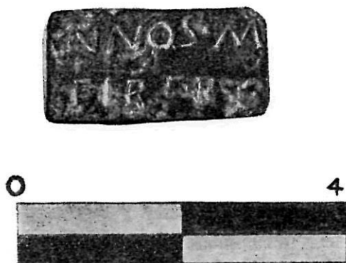
FIG. 4. Fragmento de placa de bronce con inscripción, de Bíbilis (Calatayud).