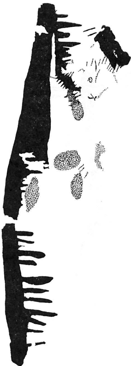
Fig. 4. — Figura con características de ramiforme de tipo vegetal, asociado con puntiformes