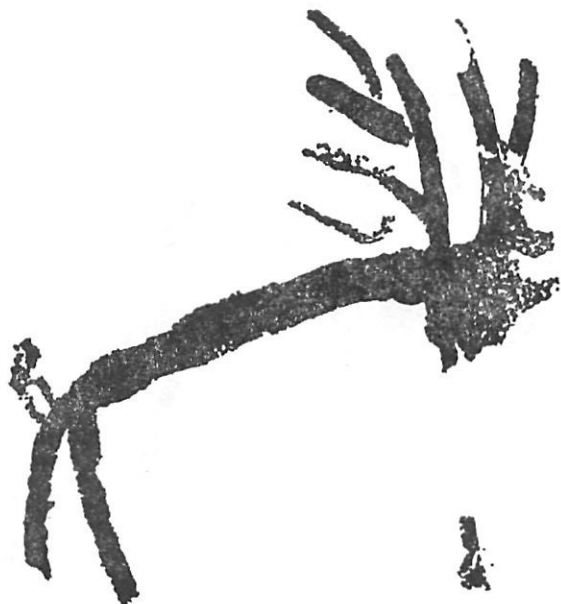
Fig. 6. — Figura de ciervo de tipo esquemático del Abrigo de Las Jaras

En la estribación sur del macizo del Rodriguero, y a escasos kilómetros de la Cueva del Carvajal, publicada por H. BREUIL en su tomo