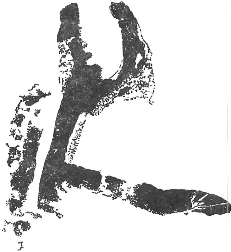
Fig. 3. — Posible representación de antropomorfo cornudo. Grupo de los Organos. Desfiladero de Despeñaperros (Jaén)