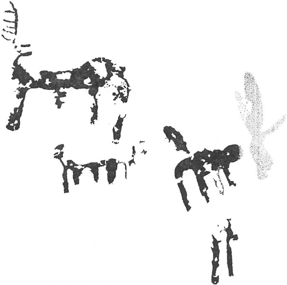
Fig. 7. — Escena de cuadrúpedos del Abrigo de Las Jaras

El Abrigo se encuentra a unos tres kilómetros de la finca del Carvajal 11 y relativamente próximo a un embalse. El friso presenta varios núcleos de pinturas de color castaño rojizo. El primer grupo se halla ubicado en la parte inferior izquierda del Abrigo (figura 7), mientras que el segundo núcleo ocupa la parte central del covacho. En este lugar destaca una figura de ramiforme (figura 8), rodeada en la parte superior de puntos que le confiere un aspecto arboriforme. A ambos