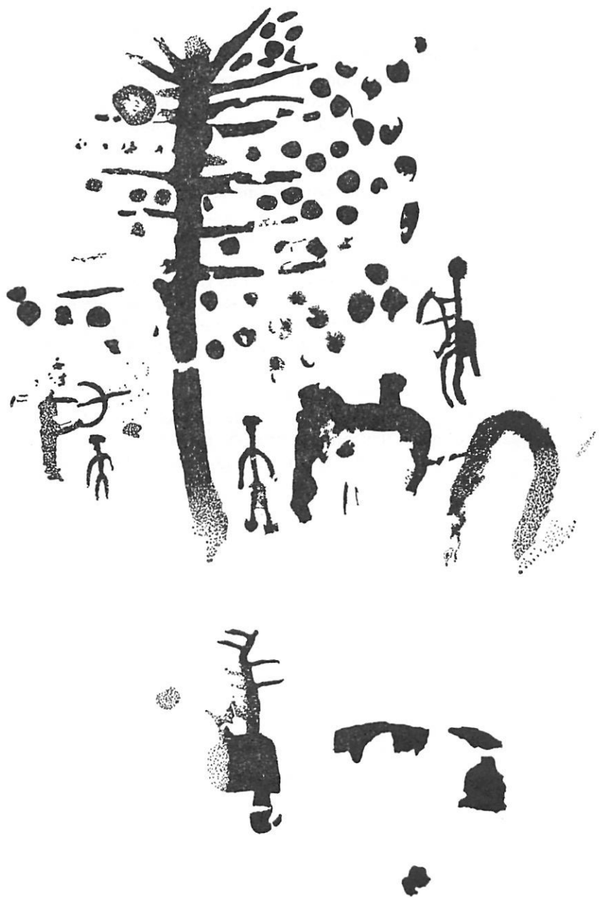
Fig. 8.— Composición de figuras humanas, algunas provistas con arco, ramiforme con puntos, petroglifos y cérvidos del Abrigo de Las Jaras