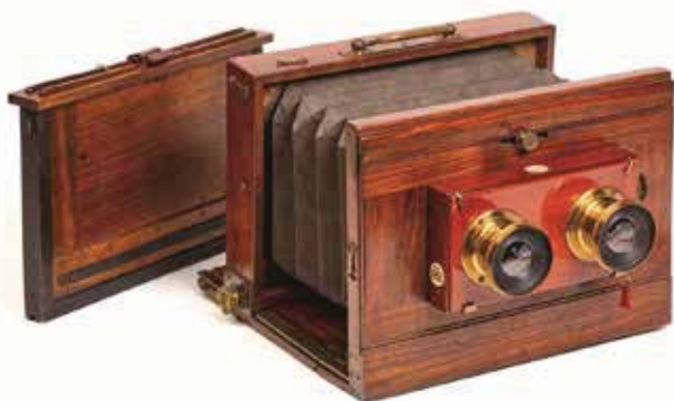
Cámara estereoscópica de fuelle. Reino Unido, ca. 1880. Colección Boisset-Ibáñez, Zaragoza.