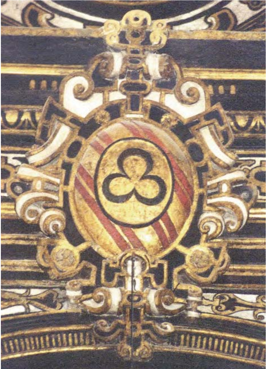
Figura 2. Armas de Ferrer.