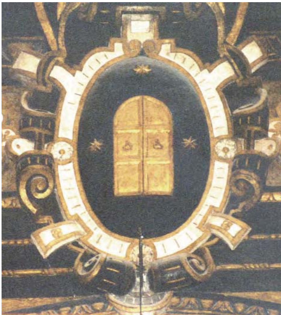
Figura 1. Armas de Zaporta.

La rama de España usa: en campo de azur, una puerta de oro, acompañada de tres estrellas de oro de ocho puntas, una en jefe y otra a cada flanco (figura 1). 31