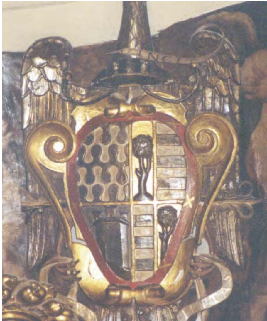
Figura 4. Armas de Virto de Vera.

ricohombre de Aragón, sirvió en 1358 al rey don Pedro IV de Aragón en la guerra contra el rey de Castilla. Este mismo asistió a las Cortes del año 1384. En el año 1391 se halló en guarda y defensa de la localidad de Camarasa y allí