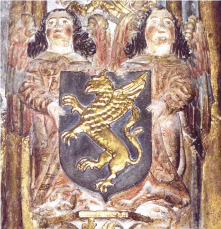
Figura 5. Armas de Espés.

Posee un arco de ingreso rebajado y con crestería gótica, pero es barroca y suntuosa por sus materiales. El resto de la portada de piedra negra de