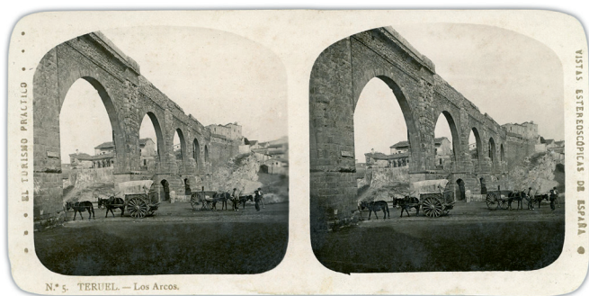
Los Arcos, Teruel. El Turismo Práctico , ca. 1920