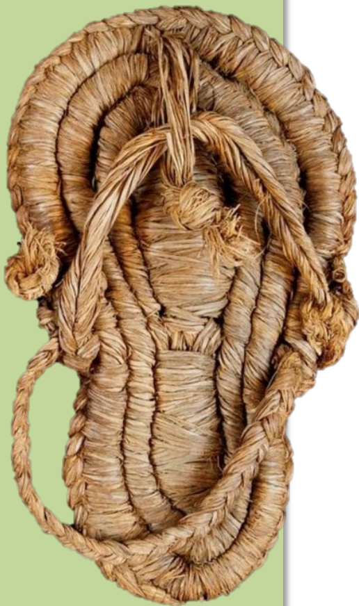
Cueva de los Murciélagos de Albuñol (Granada)

La manutención corre a cargo de cada participante.