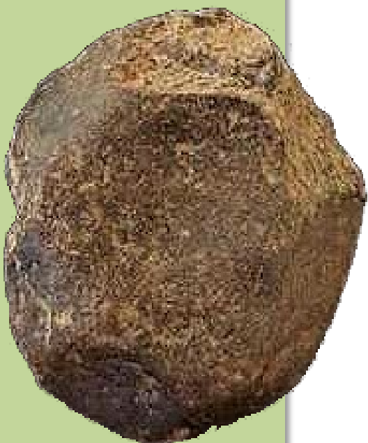
Pesa para pesca con red. Cueva de Maedum (Corea del Sur)

Supone que para comprender realmente una tecnología del pasado, especialmente aquellas que implican materiales efímeros o técnicas corporales complejas, como el anudado, el tejido, la cestería, no basta con analizar los restos materiales, sino que es necesario revivir el gesto técnico: experimentar con las manos, sentir la resistencia del material, descubrir los errores y soluciones que surgen del hacer, descubrir la relación entre cuerpo, entorno y herramienta.